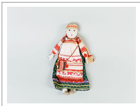
Кукла в народном костюме «невеста»